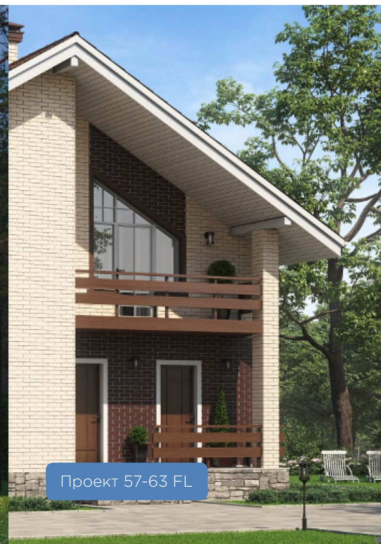
Проект 57-63 FL